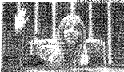
Processo contra a deputada Flordelis também está na pauta do Colegiado

O primeiro item do Processo 21-2021, referente à Representação nº 17-19 do Membro Honorário da Câmara, que trata de quebra de sigilo parlamentar por parte do deputado Daniel Silveira. O processo chegou na colegiada na terça-feira (23). O deputado foi preso em flagrante pelo Pelotas (cidade de Rio de Janeiro) na terça-feira (18), por